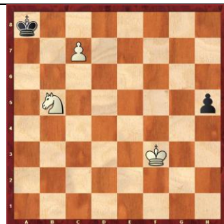
Zadanie 64 1X