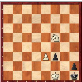
Zadanie 61 1X