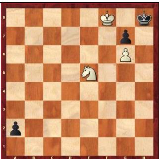
Zadanie 59 1X