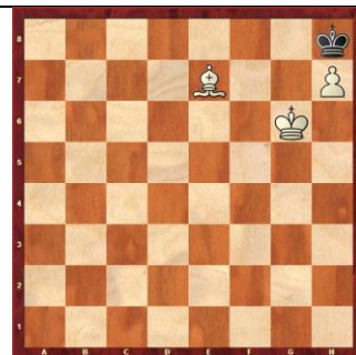
Zadanie 39 1X