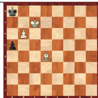
Zadanie 37 1X