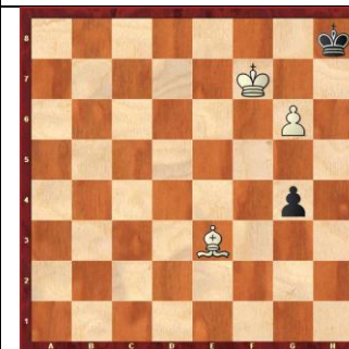
Zadanie 36 1X