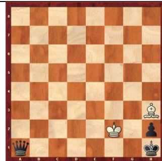
Zadanie 33 1X