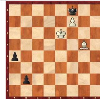
Zadanie 34 1X