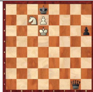
Zadanie 58 1X