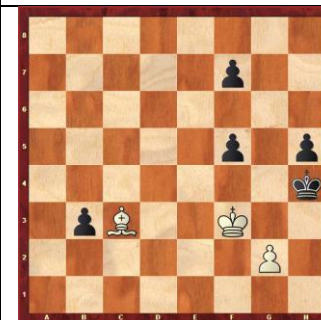
Zadanie 40 1X