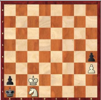
Zadanie 57 1X