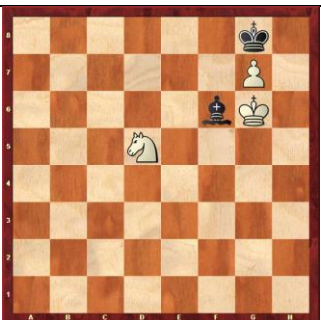
Zadanie 63 1X