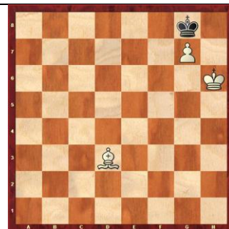
Zadanie 35 1X