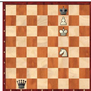
Zadanie 60 1X