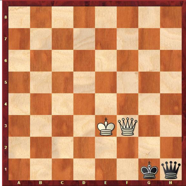
Zadanie 6. Mat w 1 posunięciu.