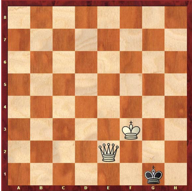
Zadanie 3. Mat w 1 posunięciu.