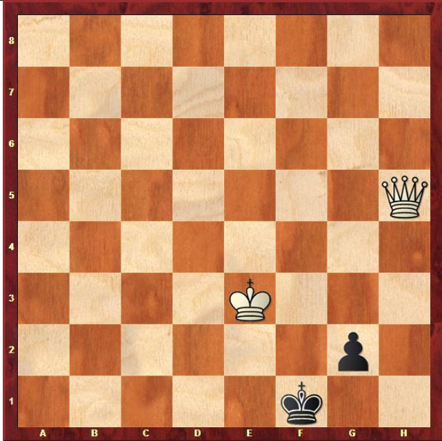
Zadanie 5. Mat w 1 posunięciu.