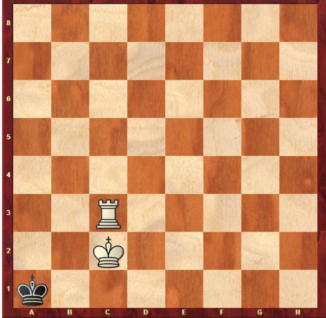
Zadanie 1. Mat w 1 posunięciu.